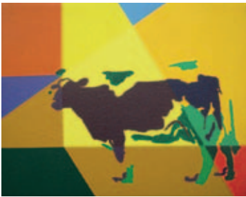
482 | Christian Schmidt-Rasmussen | Forever Young (C) | 1994 | Akrylmalerier | 22 × 27 cm | Kr. 2.500 |