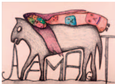
Afmagt | 2002 | 81,3 × 101,6 cm |

Men hvad historien herudover handler om, og hvilken forbindelse der er mellem de tre væsener, hvis en sådan eksisterer, er et åbent spørgsmål, som kunstneren overlader til den enkelte betragter at søge sin egen forklaring på.