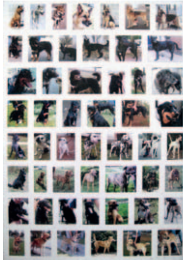
502 | Henrik Olesen | Same-different | årstal? | Offset litografi | 84 × 59,5 cm | Oplag: 300 + 25 A.P. | Kr. 800 |

papir af høj kvalitet samt at udbrede kendskabet til den aktuelle billedkunst. Vi udgiver værker af væsentlige nutidskunstnere, fortrinsvis på et tidligt tidspunkt i deres karriere, hvor vi med udgivelsen kan være med til at præsentere kunstnerne for et større publikum. Hver udgivelse ledsages af bladet Medlemsnyt hvori vi informerer om udgivelserne, kunstnerne bagved, og om foreningens virke i øvrigt. Vi arrangerer endvidere – ved særlige lejligheder – udstillinger med foreningens udgivelser.