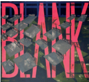
488 | Jesper Christiansen | Blank | 1996 | Stentryk i 5 farver | 55,5 × 53 cm | Oplag: 400 | Kr. 800 |