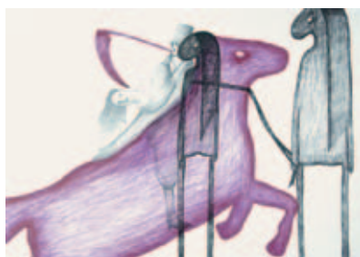
Intens interaktion | 2006 | 59,4 × 42 cm |