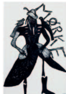
Mørke | 2008 | 42 × 29,7 cm |

Men hvad er et væsen? Væsener optræder allerede i den græske mytologi, i folkeviser og eventyr, i alle dele af verden. Et væsen er en skabning, der ikke findes i naturen, men er sat sammen af enkeltdele fra virkelige dyr og af mennesker. Væsener er mytiske, tillægges særlige egenskaber, og er udtryk for dybtliggende psykiske kræfter og konflikter: seksualitet, magt, fødsel og død. Væsener er altså en slags hybrid mellem menneske og dyr eller mellem flere dyr. De kan fx vise sig i form af en drage, som kentaur, der er en kombination af mand og hest, eller som havfrue, der er halvt kvinde og halv fisk. I dag møder man sådanne skabninger i populærkulturen, fx i rollespil, videospil, tegneserier og film, hvor de ofte har en afgørende indflydelse på handlingen i historien.