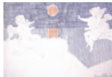
463 | Inge Ellegaard | Uden titel | 1989 | Blyant og filtpen | 32,8 x 48 cm | Kr. 800 |