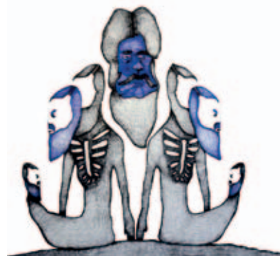
Hierakisk opbygning | 2009 | 100 × 80 cm |