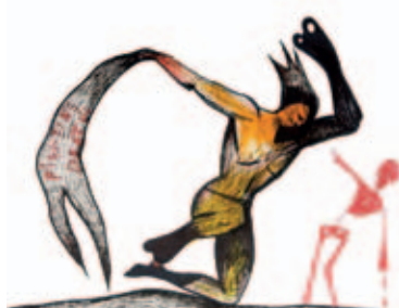
Fighting Death | 2010 | 29,7 × 42 cm |