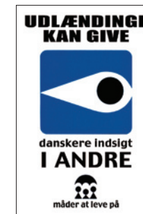
“Andre måder at leve på” | 2001 | klistermærke | 8 x 6 cm