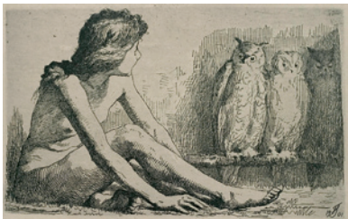
202 Frans Schwartz: Pigen med ugerne | 1901 | Radering | 9,5 x 15,3 cm | Kr. 400