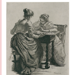
153 Frans Schwartz: Halmaspillerskerne | 1894 | Radering | 16,9 x 14,3 cm. Kr. 400