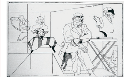
419 Sys Hindsbo: Mand med kulisser | 1972 | Radering | 25,1 x 39,1 cm | Kr. 450