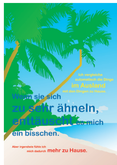
“Mehr zu Hause” | 2003 | offset-tryk | 84 x 59,4 cm