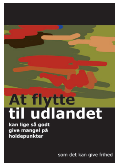
“For at gøre det sværere for mig selv” (Detalje) | 2001 | inkjet-print | 84 x 59,4 cm

arbejdet i Berlin. Mange af hendes tekster kredser om de identitetsmæssige konsekvenser, som dette selvvalgte eksil har. Hun italesætter, hvordan hun opfattes anderledes i andre kontekster end den hjemmevante – og også hvordan hun selv påtager sig andre roller og holdninger i den fremmede sammenhæng. Mange af hendes tekster kredser om, hvordan det er, ikke til fulde at kunne tale og forstå det sprog, som omgiver en. Det interesserer hende, hvordan betydningsnuancer i den situation forsvinder og misforståelser og tvetydigheder opstår. Hendes egne tekster bruger netop sproget på denne måde og benytter sig bevidst af ambivalente formuleringer og antydninger af modstridende udsagn.