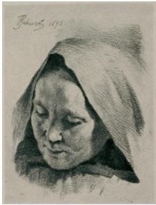
168 Frans Schwartz: Ældre kone med hætte over hovedet | 1895 | Radering | 12 x 9,1 cm | Kr. 400