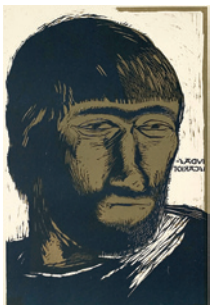
344 Jais Nielsen: Judas Iskariot | 1937 | Farvetræsnit | 38,5 x 26 cm | Kr. 550