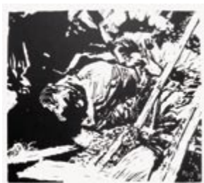
428 Peter Louis Jensen | Vietnam m.fl. | 1979 | Serie på 5 linoleumssnit | 49 × 40 cm | Oplag: 700 | Kr. 1.250 |