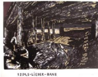
438 Kehnet Nielsen | 1 2 3 4, 5 Liederbane | 1983 | Linoleumssnit i 3 farver | 52 × 65 cm | Oplag: 550 | Kr. 500 |