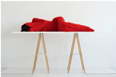
Red Suite | 2007 | Lucia-print | 3 | Hver 103 × 145 cm

måder bevæger værket sig på grænsen af vores fatteevne, og drager os i retning af det, vi ikke kender, det vi ikke kan se.