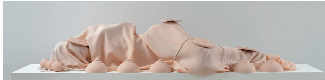
Entwined | 2011 | Lucia-print | 1 af en serie på 4 | Hver 67 × 200 cm

Sideløbende med sit arbejde med skulptur har Kalkau et virke som lyriker og essayist, hvilket har resulteret i en lang række små udgivelser fra hendes hånd. Viften af publikationer strækker sig fra æstetiske refleksioner i Æstetik... at svare verden igen med værket (1996) over det essayistiske manifest Små ryk (1999) til dramaet Kettys have. Et drømmespil (2003). Selv om publikationerne genre-mæssigt er meget forskellige i deres udtryk, er Kalkaus skriftpraksis generelt