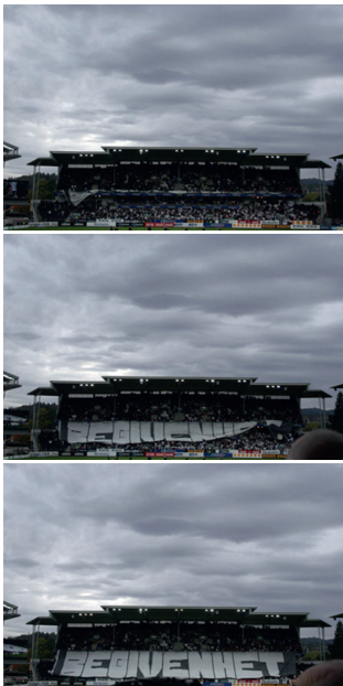
515 | Katya Sander | Begivenhed (Tifo) | 2008 | 3 fotografier | Hver 21,7×33 cm | Oplag: 400 | Kr. 1.200 |