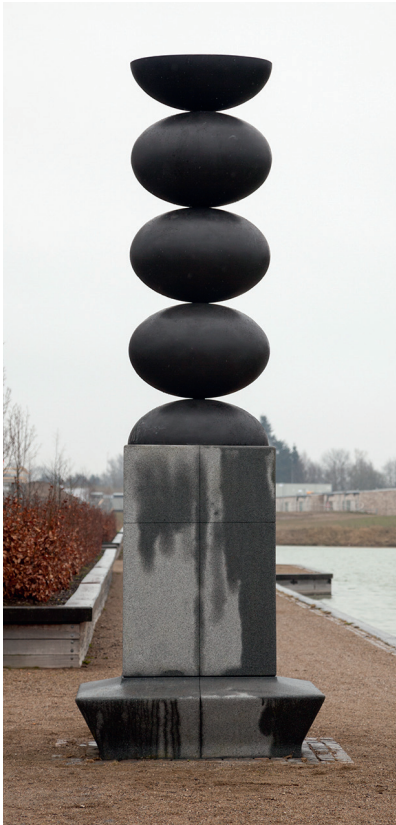
Sort Søjle | 2012 | Bronze | 470 cm × 200 cm

sluttet enhed. De mandsstore former, sokkelløst hvilende direkte på gulvet, taler til ens krop, appellerer til berøring, men afskrækker i deres intimiderende hvidhed og perfektionerede formfuldendthed samtidig fra ethvert forsøg på kontakt. I deres subtile kombinationer af enkelthed og kompleksitet opstiller Kalkaus skulpturer en slags kroppens matematik, kalkulationer over tyngdekraftens effekter, balancens præcision, tiltrækningens uafvendelighed.