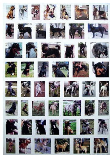
502 | Henrik Olesen | Same-Different | 2001 | Offset i 4 farver | 84 x 59,5 cm | Tryk: Interprint, København | Oplag: 300 + 25 AP | Kr. 900 |