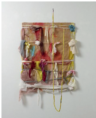
Astrid Svangren | blomster / ljung / tulpan [...], 2012 | 122 x 94 cm | Olie og akvarel på silke, bomuld og MDF | Foto: Anders Sune Berg

Ideen om det ufærdige og noget der er under udvikling, kommer også til udtryk gennem flere af trykkets forskellige motiver. Der er botaniske vækster, der groer, et stearinlys der brænder ned og en sommerfugl, der repræsenterer et kort stadie i en hastig forvandlelingsproces fra puppe til larve til flyvefærdigt insekt. Et andet motiv er de runde glaskolber med snæver hals, som benyttes til kemiske processer, og som antyder Astrid Svangrens