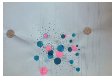
503 | Kirstine Roepsdorff | Loup Loup - Awaiting the Tunder | 2001 | Blyant og glimmer på hvidt karton | 50 x 70 cm | Kr. 4.000 |