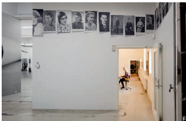
Exhibit Module 2 | 2016 | Media: Wallpaper

Ligesom titlen på udgivelsen er Jonathan Monks kunstnerskab ikke baseret på noget defineret sprog. Det er en konceptuel praksis, der nægter at lade sig definere af en bestemt form eller signaturstil. Hans samlede oeuvre spænder vidt over tekstbaserede værker, tegninger, malerier, objekter, fotografier, video og slideprojektioner m.m. Ofte handler hans værker om andre kunstneres værker; særligt reeksaminerer han elementer fra minimalismen, Pop Art og konceptkunstens velmagtsdage i 1960-70'erne. Med en uhøjtidelig tilgang undersøger han centrale emner om originalitet og kunstnerisk ophav. Hvad er en kopi? Hvordan ændres vores syn på originalen, når det er volumen af kopier, der er i centrum for værket, frem for det enkelte billede? Selv har Monk udtalt om fotografiet, at han er "mere interesseret i mulighederne bag reproduktionen end selve billederne." Dette demonstrerede han eksempelvis på soloudstillingen Exhibit Model Two i 2016. Her totaldækkede Monk galleriets