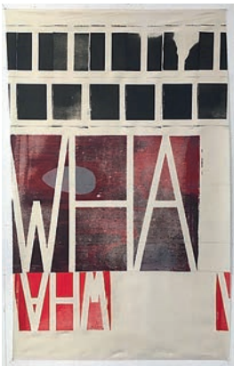
541 | Mette Winckelmann | Uh Wha Wha | 2017 | Silketryk på bomuldsstout | 96 × 60 cm | Oplag: 400 | Medlemspris: 1.400 kr.