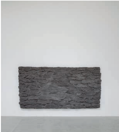
Månen spejler sig og indser | 2017 | Beton og sort pigment | 180 x 93 cm | Tilhører: Statens Kunstfond

selv blevet spejlet og har forenet sig med en armeret betonkrop. Det færdige relief består både af et negativt rum og en omvendt logik. Noget løst er blevet fast – og en konkret idé har til gengæld fået et abstrakt udtryk.