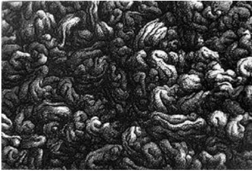
466 | Michael Kvium | Tankemodel | 1990 | Radering | 14 × 20,9 cm | Niels Borch Jensens Kobbertrykkeri, København | Oplag: 425 | Medlemspris: 2.400 kr.