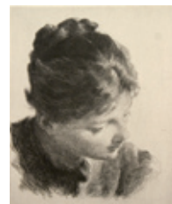
256 Frans Schwartz: Ung pige i halv profil, seende nedad | 1913 | Radering | 14,5 × 11,9 cm | Kr. 400