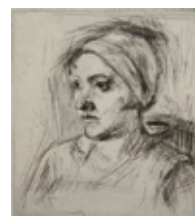
371 Henry Nielsen: Kvindeportræt | Radering | 12,2 × 10,3 cm | Kr. 350