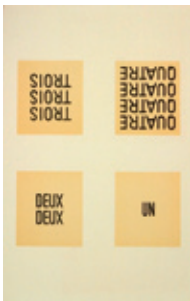
434 a-c Poul Pedersen: 4 Tabloemes: Reduction, Oiseau, La Toile & Valse Anglais | 1982 | 3 stentryk | 47,5 × 65 cm | Kr. 800