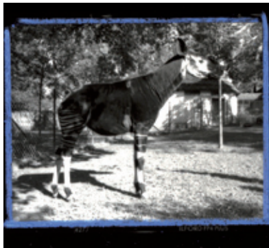
Gold-Toned Okapi / Test | 2006 | detail.

Fotografiet til Radeerforeningen er et klassisk sort/hvidt fotografi, hvor negativfilmen fremkaldes i mørke-