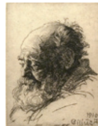
235 Cilius Andersen: Den gamle mand fra Stige | 1910 | Radering | 9 × 6,8 cm | Kr. 300