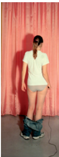
505 Annika von Hausswolff: Sad memories of pink | 2002 | Fotografi | 70 × 28 cm | Kr. 550