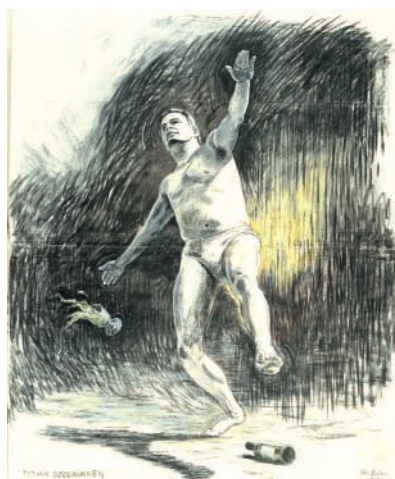
Tizian døddrukken, 1993 (kul og kridt på papir, 300 x 250 cm).

De billedmættede omgivelser med alt fra de mest trivielle fidusbilleder og reklamer til de kanoniserede mester værker fra verdenskunsten leverer kulisser til iscenesættelsen af den slags genrebilleder, som er blevet mit billedkunstneriske virkefelt. Selviscenesættelsen er et af de mest brugte greb i mine arbejder. Noget jeg har til fælles med en lang række kunstnere, der hver især bruger selvfrestillingen vidt forskelligt. Allerede inden jeg havde nogen anelse om, at det var der, mit arbejdsfelt skulle ligge, var min interesse for og beundring af J.F. Willumsen stor.