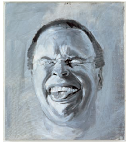
I ONLY PAINT WHAT I FEEL nr. 19 (Maleri).

I tegningen Tizian døddrukken fra 1993 mimer jeg Willumsens selviscenesættelse. Willumsens Tizian, der er døende, er ved at falde bagover ned i det sorte dyb, men hvor hans maleri overbevist