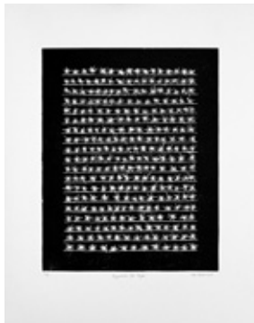
526 | Ester Fleckner | Argumenter for begær | 2013 | Træsnit | 47×38 cm | Oplag: 28 | Kr. 800