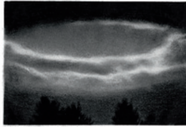
Andreas Albrechtsen | Spillway / skypunch | 2012 | Grafit på papir | 56 × 76 cm

sidst tegningen. Undervejs et sted mellem originalen, Google-gengivelsen og tegningen mistes den præcise kontekst og netop denne autonomi interesserer ham. Motivet står der selvstændigt udenfor tid og historie, men samtidig er de vidnesbyrd om noget fortidigt. Med tegningen som et retorisk virkemiddel opbygger Albrechtsen en ny, mere personlig, fortælling om billedet, men samtidig sikrer gennemsigtigheden fra fotografiet til hans tegning, at den oprindelige sta-